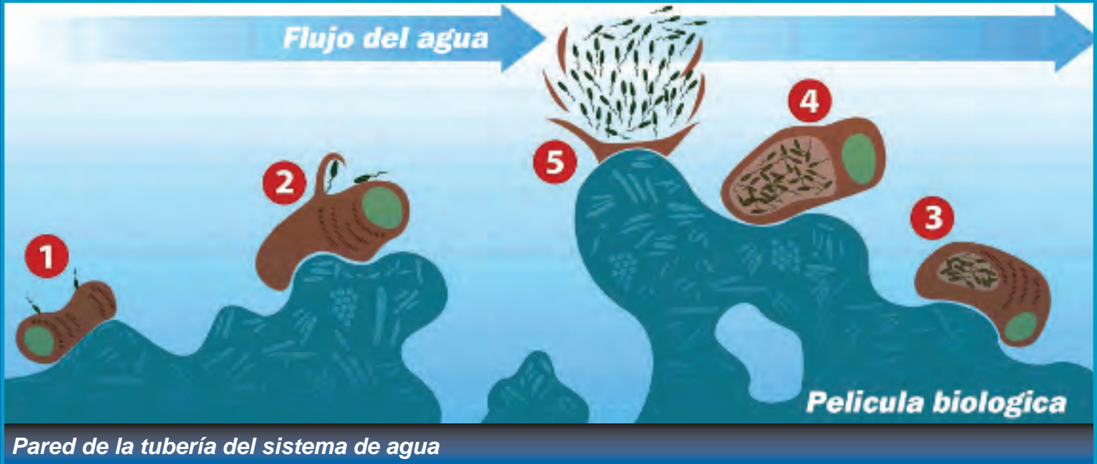
Figura 1: Ciclo Vital de la Legionella en un Sistema de Agua en un Edificio. 1) Las amebas pastan en la película biológica consumiendo bacterias como alimento pero son 2) infectadas por Legionella la cual 3) crece intracelularmente y después 4) abruma su célula huésped del protozoario, distinguiéndose en las células móviles y 5) causa el lisis de la célula huésped la cual puede lanzar centenares o millares de progenies infectados en la búsqueda de nuevos anfitriones para infectar.

Impreso con el permiso del diario de ASHRAE, 2006.